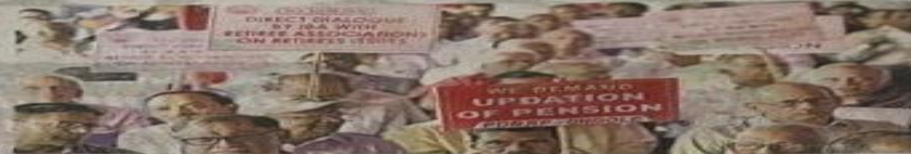
Members of the United Bank Retirees Organisation staging a protest in Vijayawada on Tuesday. K.V.S. GIRI