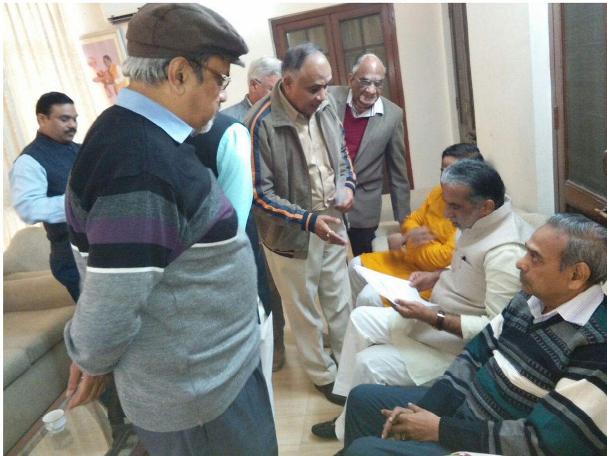
AIBRF delegation with Sh. Krishan Pal Gurjar – Honorable Minister of State – Social Justice